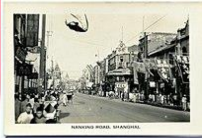
20世紀30年代的南京路

南京路 是位於中國上海市的一條世界知名的商業街。狹義的南京路即1945年以前的南京路，專指今天的南京東路。廣義的南京路則包括南京東路和南京西路。